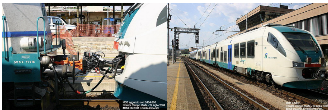
Nelle foto, a sinistra l'aggancio tra E424 e Minuetto, a destra il treno MD1

Alle 16.43, come treno 26074/16029, il complesso si è portato presso l'Impianto Dinamico Polifunzionale di Sesto Fiorentino/Osmannoro ove i due Minuetto Diesel saranno muniti delle apparecchiature necessarie alle prove in linea RFI operate dal personale del Centro di Dinamica Sperimentale. Particolare interessante il gancio automatico di cui è munita la E424-306 per poter trainare veicoli di nuova generazione sprovvisti del gancio classico.