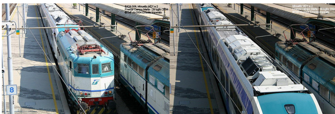
Nelle due foto: A sinistra l'arrivo del treno a Campo di Marte e l'imperiale del Minuetto Diesel

Trainati dalla E424-306 in carico a RFI, con velocità limitata a 50 km/h, le due automotrici, inattive, sono partite come treno 87710 da Colleferro alle 9.25, per giungere, come treno 77320 a Firenze Campo di Marte alle 16.31.