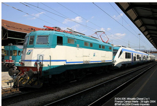
Nella foto il convoglio parte alla volta di Osmannoro

News di E. Imperato e D. Romanelli