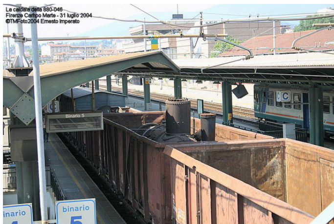
nelle due foto i carri Eaos. Si vede la caldaia della 880-046 e un asse

La 880-046, completamente "fatta a pezzi", era custodita in tre carri Eaos che chiudevano il treno