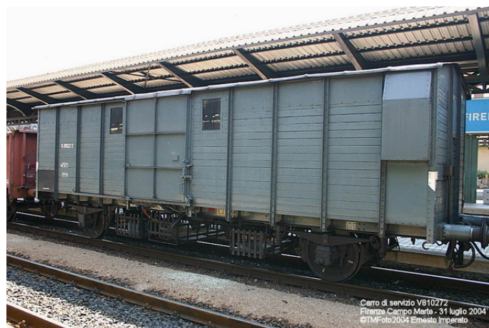
Carro soccorso Vs 810272

e con un carro soccorso, classificato Vs810272, di costruzione 1948.