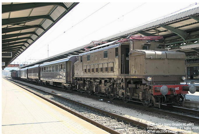
nella foto la 626-443 alla testa del treno storico del Gruppo ALe883

La 880-046, completamente "fatta a pezzi", era custodita in tre carri Eaos che chiudevano il treno