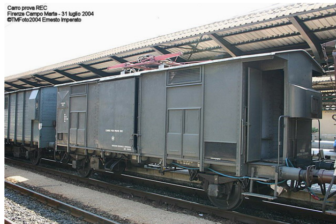
Il carro VRe

Il treno si completava con due carri di servizio, il Vre 951-3-100, in grigio, carro prova REC, unico esemplare in Italia, dotato di pantografo per l'alimentazione degli apparati di prova del REC, costruito nel 1939,