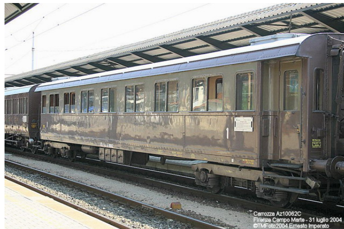
nella foto la Az10062

Nulla è stato trascurato, ogni valvola d'ottone è perfettamente lucida, la lampada di cabina in ottone, risplendeva. Subito dietro alla loco, la carrozza di 1 a classe, Az 10062, del 1921, recuperata nel 1994 e restaurata nel 1998, perfettamente conservata sia negli esterni, in castano e isabella, che nelle parti interne.