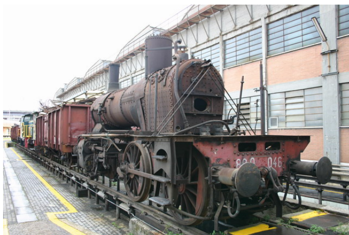
nella foto la 046 semismontata all'aperto, il 3 giugno 2004 a Roma Smistamento

Si parlava da tempo della riparazione della locomotiva a vapore 880-046 da tempo presso il GRAF a Roma. Dopo le sistemazioni in atto a Roma San Lorenzo, l'anziana vaporiera, semismontata, era stata messa alle intemperie con il serio rischio di pregiudiziale ancor di più la riparazione.