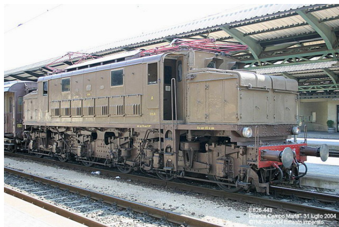
la 626-443 in stazione a Campo di marte

Nel momento in cui si redigeva questa news il treno era giunto alla stazione di Parma, in attesa di proseguire verso la Valtellina. Non si può non parlare del gioiellino che è il treno storico del Gruppo ALe883. A cominciare dalla locomotiva, la splendida E626-443