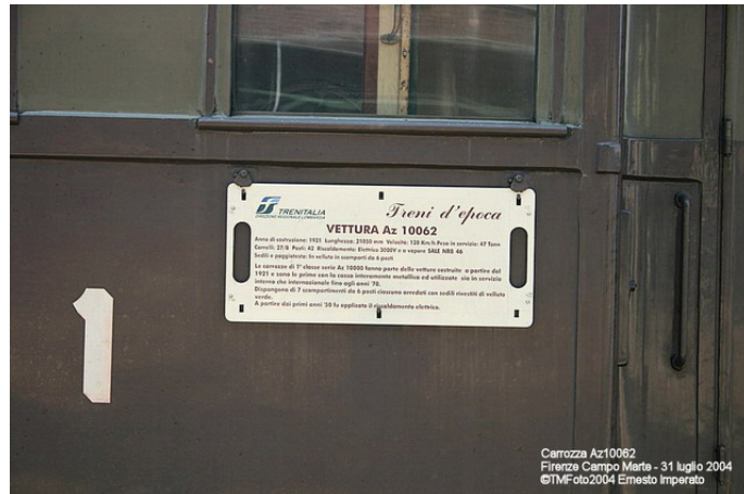
nella foto la tabella sulla Az10062

In seconda posizione la carrozza 100porte Bz37038 di 2 a classe, costruzione 1931, a salone unico. Dal 2002 il suo interno è un ristorante;