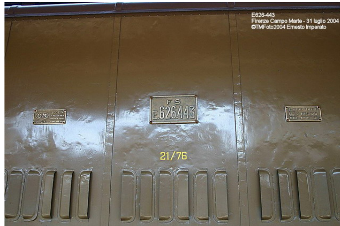
targhe originali per la vecchia loco elettrica

Nulla è stato trascurato, ogni valvola d'ottone è perfettamente lucida, la lampada di cabina in ottone, risplendeva. Subito dietro alla loco, la carrozza di 1 a classe, Az 10062, del 1921, recuperata nel 1994 e restaurata nel 1998, perfettamente conservata sia negli esterni, in castano e isabella, che nelle parti interne.