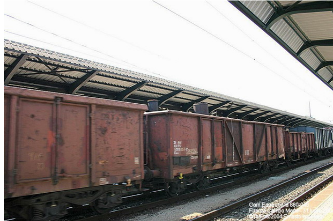
nella foto il treno in partenza verso Bologna.

Nel momento in cui si redigeva questa news il treno era giunto alla stazione di Parma, in attesa di proseguire verso la Valtellina. Non si può non parlare del gioiellino che è il treno storico del Gruppo ALe883. A cominciare dalla locomotiva, la splendida E626-443